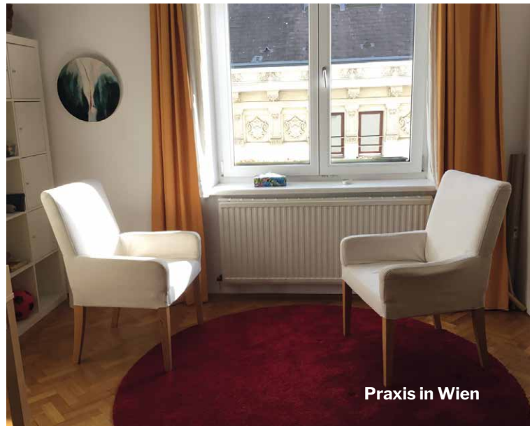
Praxis in Wien

Mein Praxisraum in Wien liegt zentral , in der Nähe von Stephans- und Schwedenplatz und ist öffentlich wunderbar erreichbar . Die Praxis befindet sich im sechsten Stock und es gibt einen Lift. Sie ist hell und ruhig gelegen. Die Großstadt bietet die Möglichkeit, anonym bleiben zu können.