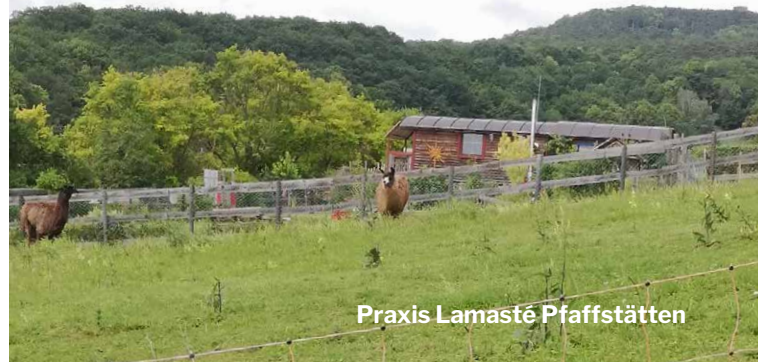
Praxis Lamasté Pfaffstätten

Hier in Pfaffstätten , mitten in den wunderbaren Weinbergen von Baden, umgeben vom Wienerwald, biete ich Ihnen Therapie unterstützt durch die Kraft der Natur an. Wir können uns draußen bewegen , uns bei den Tieren aufhalten, mit Lamas spazieren gehen oder einfach den wunderbaren Ausblick und die Ruhe genießen . Bei Schlechtwetter steht uns auch ein Raum auf dem Gelände zur Verfügung.